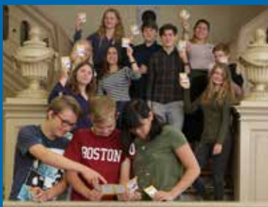
MuseumsCard Auftakt Lübeck