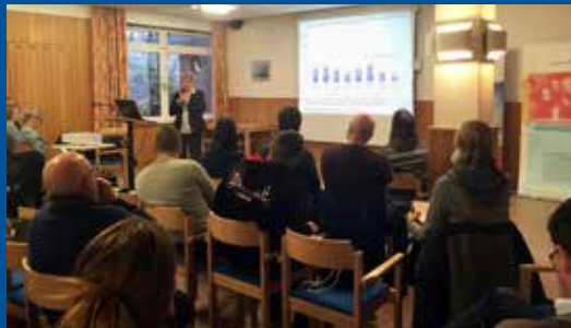
Fachtag Kinder-und Jugendbericht