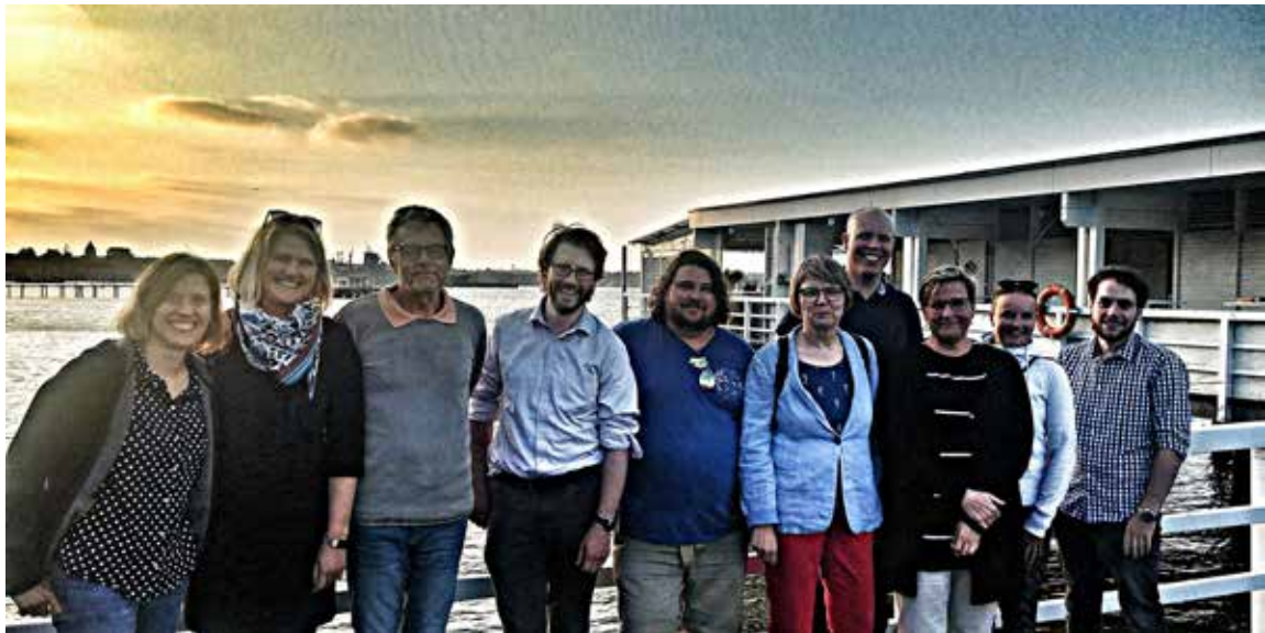
Fachkräfte der Jugendarbeit aus Südfinnland in Schleswig-Holstein